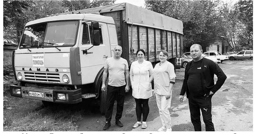
Медики Донецка благодарны Северо-Осетинскому отделению Союза промышленников и предпринимателей.

долела более тысячи километров и успешно доставила помощь медучреждению. Врачи Донецкого мед-